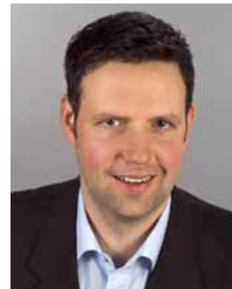
von Dr. Winfried Klein

Schillers Schädel, des Erbprinzen Gebirne, der Dunkelgräfin Knochen und andere