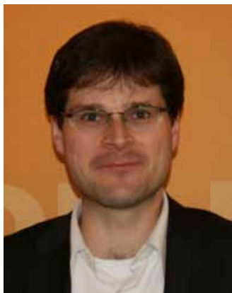
von Johannes Rothenberger

Die Sperrklausel von fünf Prozent bei Bundestagswahlen ist verfassungsgemäß. Dies hat zuletzt das Bundesverfas-