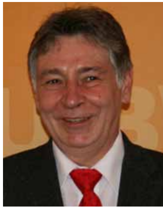
von Dr. Alexander Ganter