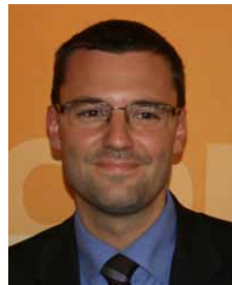
von Knut Tropf

Dass es auch auf Politikfeldern, zu deren grundsätzlicher Ausrichtung parteiübergreifender Konsens besteht, in der praktischen Umsetzung des Gewollten zu sehr heterogenen Ergebnissen kommen kann, zeigt die Diskussion um den geeigneten Rechtsrahmen für den Ausbau der Windkraft in Baden-Württemberg.